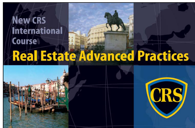
Cursos CRS en España: Soluciones para un Mercado Cambiante